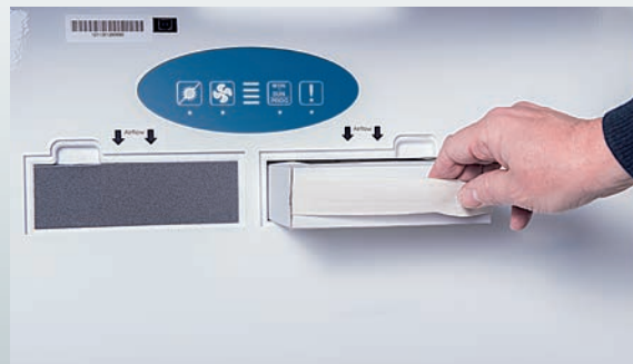
Zum Austauschen des Filters braucht nur die Blende heruntergeklappt zu werden – Filter herausziehen, neuen Filter einsetzen, zuklappen – fertig.