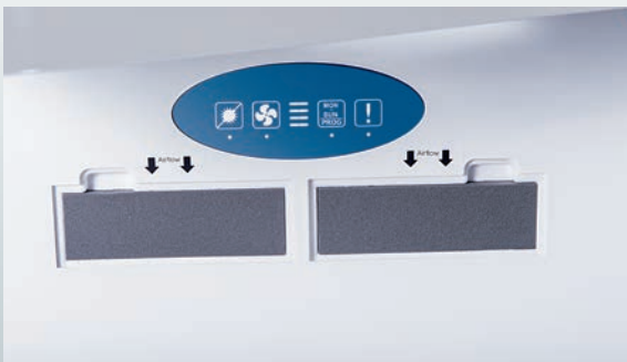
Die Filter befinden sich unterhalb des Foliendisplays. Eine LED weist auf den notwendigen Wechsel hin.